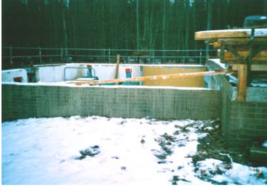
Riesler im Bau